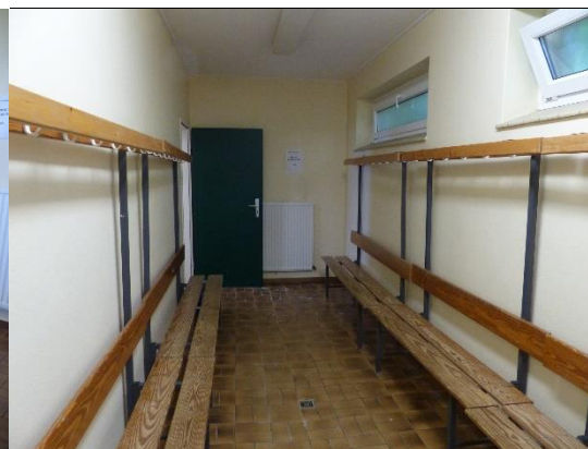
Abb. 2: kleine Kabine