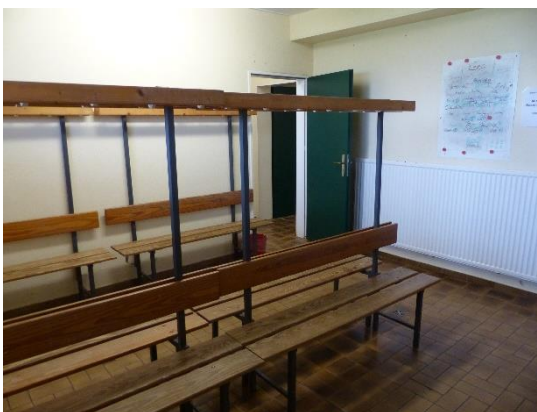
Abb. 1: große Kabine

Das Hygienekonzept ist gültig, bis neue Verordnungen aufgrund der Pandemieentwicklung das vorliegende obsolet erscheinen lassen.